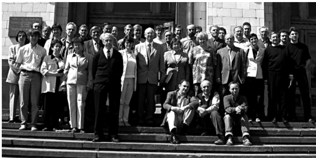
Рис. 3. Кафедра неорганической химии на ступеньках химического факультета МГУ (2005 год)

В последние годы основные достижения академика Ю.Д. Третьякова самым непосредственным образом связаны с развитием неорганической химии и современного фундаментального материаловедения в приложении к разработке новых методов получения и анализа важнейших классов наноматериалов и биоматериалов [15-25]. Фактически, Ю.Д. Третьяков выступил в роли создателя одной из крупных российских научных школ в этом направлении на базе МГУ им.М.В. Ломоносова, а также в качестве общественно-политического деятеля, способствовавшего развитию нанотехнологий в нашей стране.