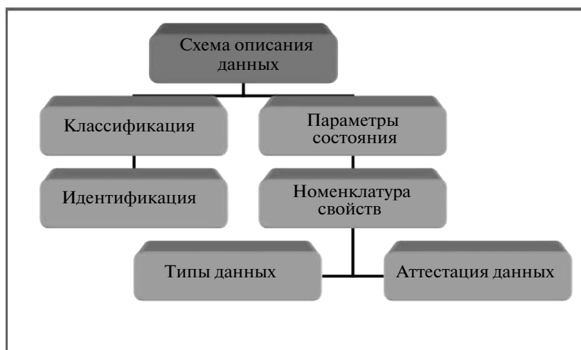
Рис. 1. Схема, иллюстрирующая проектирование фонда данных.

ных данных о типе и количестве радикалов, присоединенных к поверхности.