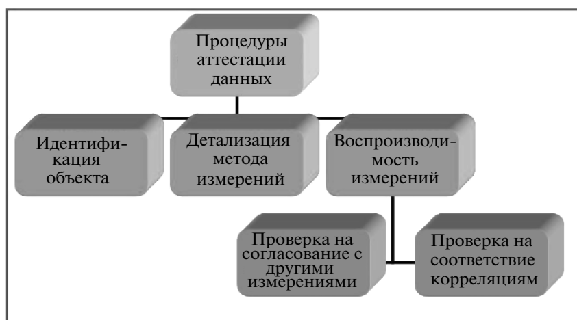
Рис. 4. Схема, иллюстрирующая процедуры аттестации данных.